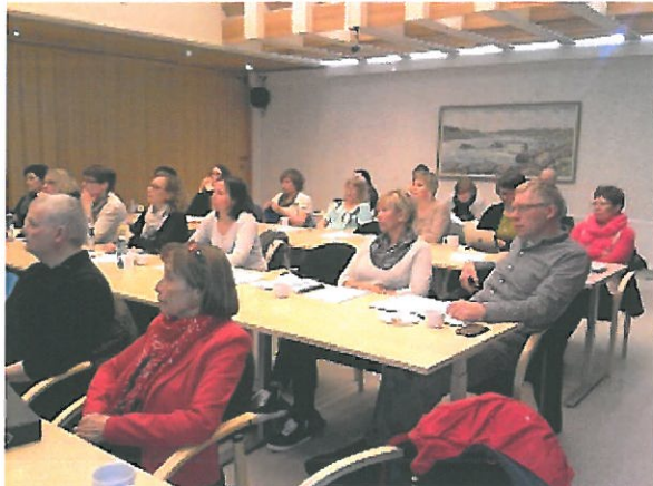
Arkivkurs i Tana 2014