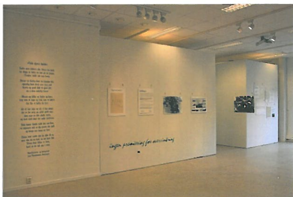
Foto og rapport fra utlån ved Gjenreisningsmuseet i Hammerfest.

Utstillingen har i 2014 vært på utlån hos: Sør – Varanger kommune, Samfunnshuset i Kirkenes og Grenselandsmuseet i Varanger og Gjenreisningsmuseet i Hammerfest. IKA Finnmark ønsker å videreutvikle utstillingen som nettutstilling og til formidling til skoler.