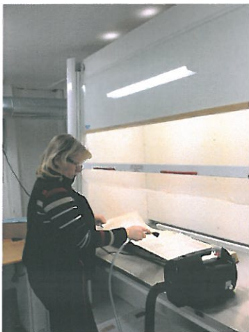
Avtrekkskap – rengjøring av protokoll

Utbedring av avtrekkskap (muggsluse) er utført i 2014 (se eget punkt).