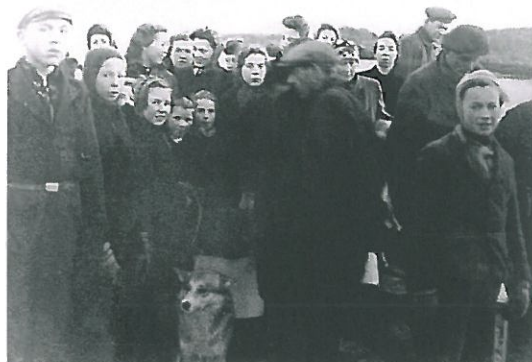
Evakuerte som venter på kaia i Gamvik høsten 1944.